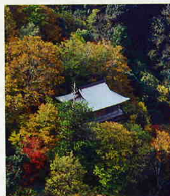
Молельня Мондзудо (храмовый комплекс Санбуцудзи)

Зарегистрированы в качестве Важных Культурных Ценностей Японии.