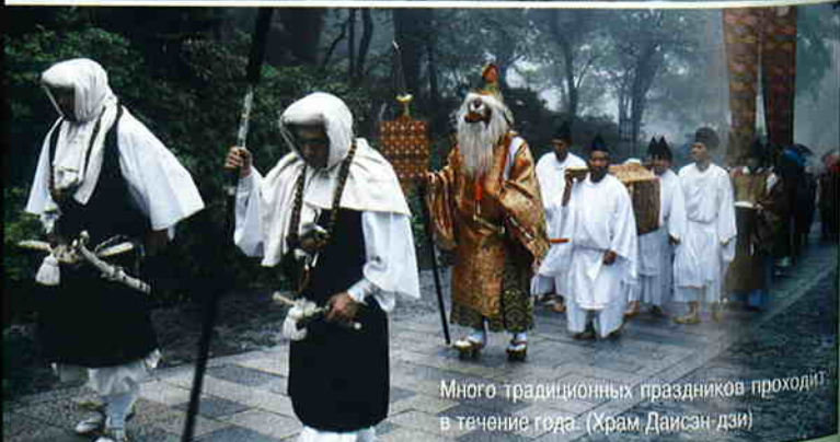
Много традиционных праздников проходит в течение года. (Храм Даисэн-дзи)