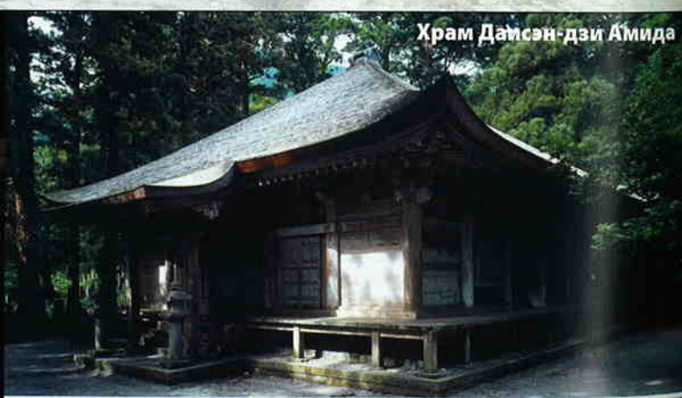
Храм Даисэн-дзи Амида

Статуя Будды хранится в старейшем здании храмового комплекса Даисэн. Важная культурная ценность Японии.